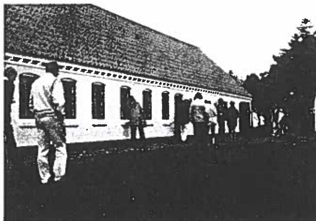
Gården, hvor "processerne er sat på museum".

Navnlig i årene efter 1920 fik Tolne skov og pavillon et meget stigende turistbesøg. Skoleudflugter søgte dertil fra Vendsyssel, ja, helt fra Aalborg blev det efterhånden tradition med særtog for skolerne til Tolne".