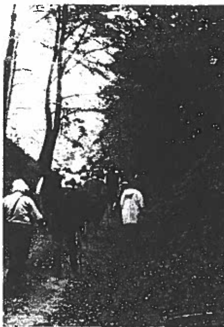
Ekskursionsdeltagerne på vej gennem en dejlig hulvej ved Bjornagergard.

Pavillonen i Tolne blev opført i 1967. I jubilæumsskriftet "Tolne skov" fra 1936, skriver Har. Skodshøj bl.a.: det var en heldig beslutning, selskabets bestyrelse gennemførte med bygningen af pavillonen på et så tidligt tidspunkt. Den naturskønne bogeskov og de omkringliggende berømte bakker havde altid tiltrukket mange mennesker. Nu fik de et sted at samles, hvor de kunne komme under tag og få noget at spise. Pavillonen gav et vældigt opsving i besøget, endnu flere store folkemøder og udflugter blev henlagt hertil, og virksomheden blev en god forretning for både forpagter og selskab. Forpagtningsafgiften gav i hvert fald i de første 25 år et betydningsfuldt tilskud til dækning af de faste årlige udgifter.-