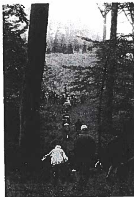
På vej ned gennem bogeskov i Slotved skov.

Den ene af hulvejene ligger under en af skovens bronzealderhøje; denne vej var her altså for højen.