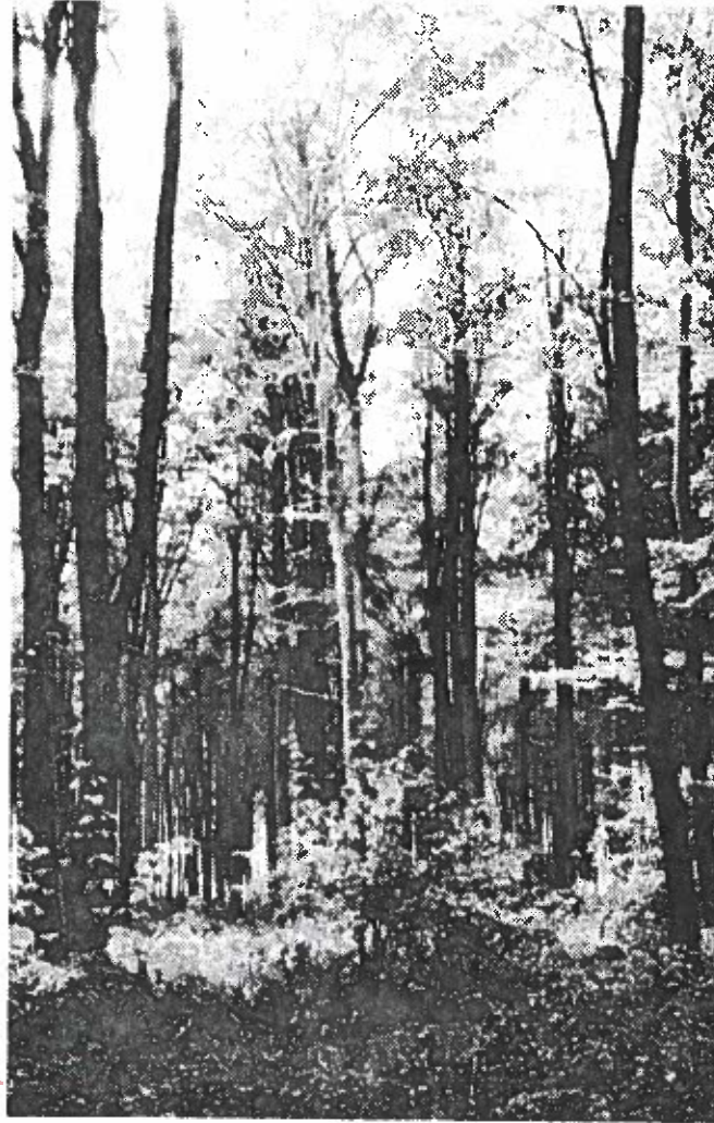
100-årige bøge i Thurø Fredsskov.

Fællesskov var engang det almindeligste i Danmark, og skovejerne var delt op i ejere af overskov, ejere af underskov og indehavere af græsningsretten. Således havde