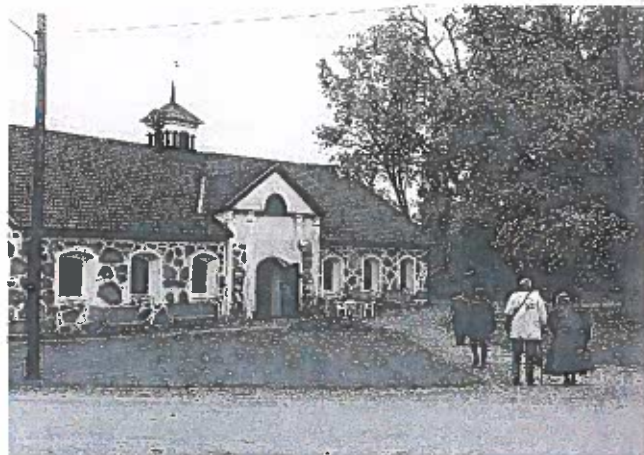
Huseby Bruk. Hestestalden, hvor vi indtog frokosten.