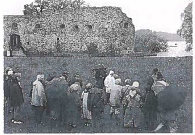
Kronoberg, der blev brugt som fæstning mod bønderne - og mod danskerne.

Skovene i Småland har i tidligere tider set helt anderledes ud end i dag. Først efter 1500 kommer granen mere og mere ind. For at illustrere skovens udbredelse og sammensætning uddeles en fin kopi