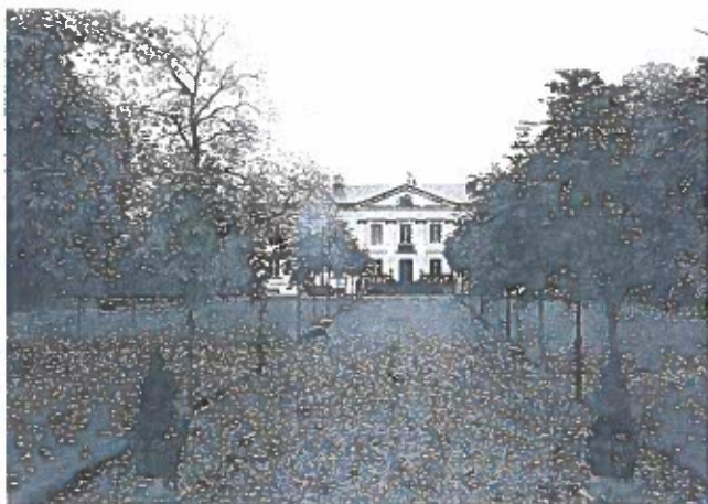
Hovedbygningen på Huseby Bruk.

Fredag d. 24. september startede den jyske afdeling med 20 deltagere til Växjö, hvor vi overnattede på vandrehjemmet ved Helgasjön.