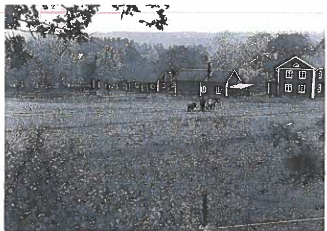
Lädja. Hestene giver gode muligheder for at redde landskabet, som det så ud for et par hundrede år siden.

Under udskiftningstiden 1827 havde den ene halv gård én ejer, mens den anden ejedes af fire. Landsbyen bestod af mange og små agre. Eng-området var meget vigtigt. Uden engene kunne man ikke have