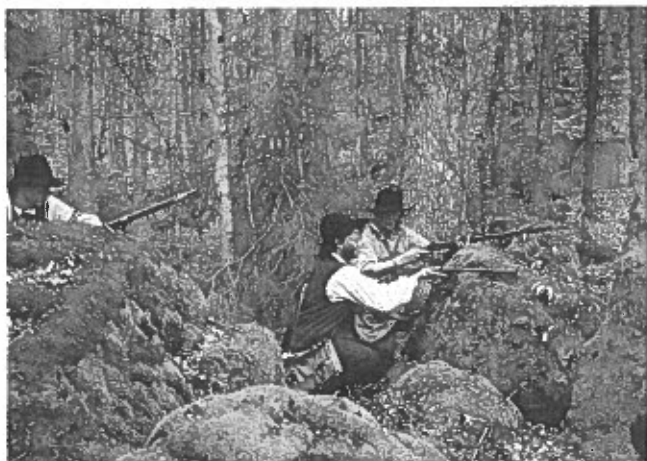
Endnu findes der snaphaner i Skåne.