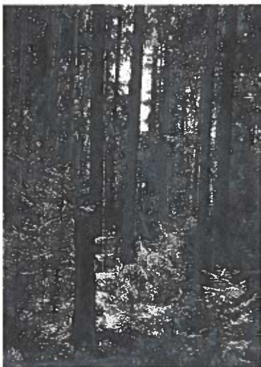
I den urørte Nytebodaskogen.

Efter den hyggelige frokost og en hurtig afviklet generalforsamling kørte man til Nytebodaskogen.