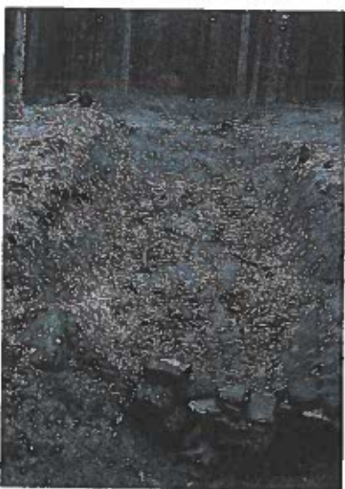
Kullaskogen, en fin bevaret tjæreovn.

I stenalderen var jagten det vigtigste. Senere begyndte man at opdyrke jorden. I de sidste par