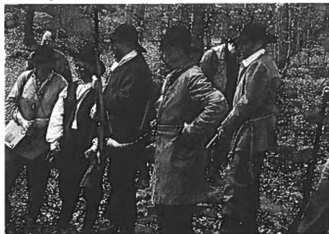
Snaphanerne var venligt stemte overfor danskerne.

Fra fægangen kigger vi ind i et unikt kulturlandskab. Oversvømmede områder giver godt med hø, år efter år. Vi kan glæde os over synet af stævningskov med lind, avnbøg og spidsløn. Vand var bondens rigdom. Efter den Sorte Død (1342) var ca. \frac{2}{3}