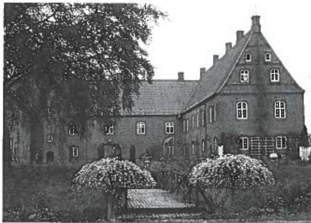
Kongsdal set fra haven.