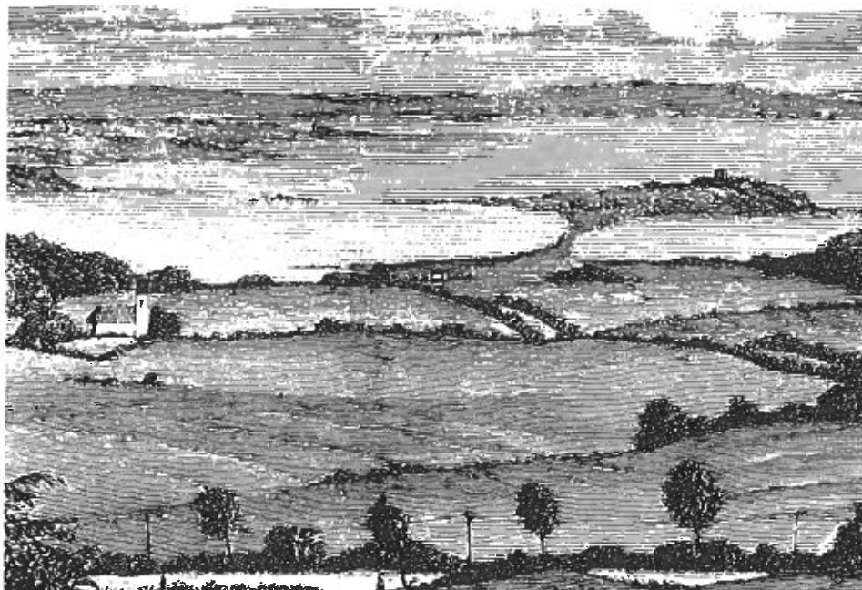
Udsigt mod Kalø Slotsruin i gamle dage.

-På Kalø var råvildtbestanden trofæmæssig og vægtmæssig dårlig, så man besluttede at skyde hele bestanden bort. Skovens folk mente, at der var 70 dyr i skovene. Da man havde gjort en stor indsats for at få alle rådyr nedlagt, lå der 213 stk. Morale: det man vurderer, der er af vildt i en skov, er man tilbøjelig til at undervurdere.