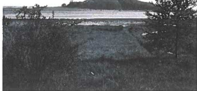
Udsigt mod Kalø Slotsruin i vore dage.

Formanden Jette Baagø sluttede dagen af med at sige: