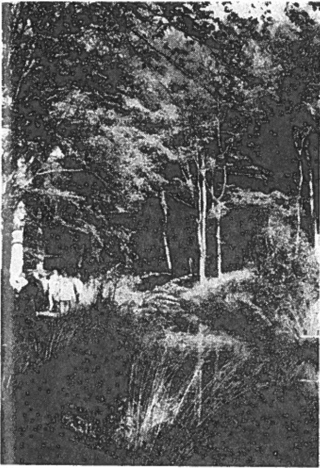
Turen langs kanalen i Teglholt skov.

spærringen. Men asken får lov at stå, thi ifølge overleveringen brænder møllen, dersom man fælder asken.