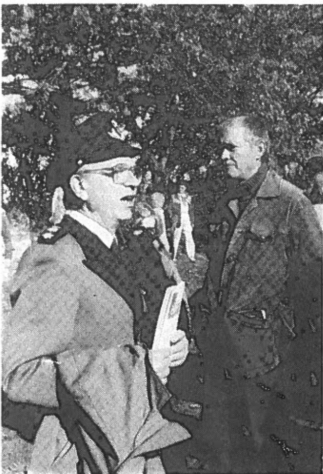
Skovrider Munkøe byder velkommen til Haderslev skovdistrikt.

Vi befinder os i en tunneldal, der strækker sig fra Lillebælt og ud til Vojens, og det gør, at vi har mange søer og åer.