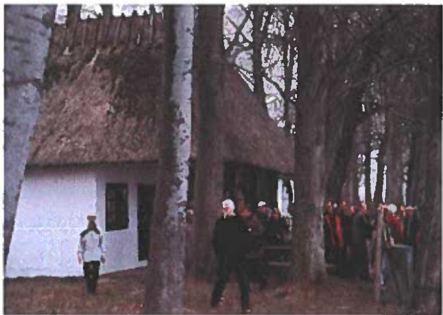
Generalens Lysthus, nær "Salten Østerstrand".

Næste stop er ved Generalens Lysthus. Det er bygget af generalen og tegnet af Andreas Kirkerup i 1786. H.C. Andersen gæstede også dette idylliske sted. Han yndede at blive klippet herude, tæt ved »Salten Østerstrand«. Wiedewelt har stået for udsmykning af lysthuset, der formentligt har været lidt større i starten, hvor det blev anlagt som et anseligt klassisk langtempel, omgivet af en søjlehal. Senere blev her drevet traktørsted af skovløberen, der boede her i nærheden.