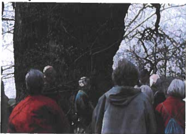
Valdemarsegen omgivet af Skovhistorisk Selskab.

Videre går turen ud til Valdemarsegen, også kaldet Fittingegegen. Den står i det sydlige skovbryn, øst for landevejen.