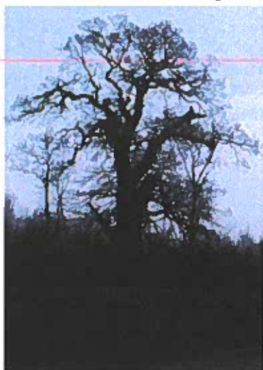
Egen "Eva" med "undervækst" af klippede bøge.

Det årlige overskud udgør 2-3 mio. kr. Man har dog faktisk haft underskud i de senere år. Fideicommis'et har måttet give tilskud til Næsgaard landbrugsskole. Der er tilskud og drift af forskellige institutioner. Haverne koster en del at vedligeholde. Ca. 1/2 mio. kr. bliver udloddet til forskellige velgørende formål. I disse år er det landbruget, der giver overskud. Indtil 1999 blev landbruget drevet ved forpagtning.