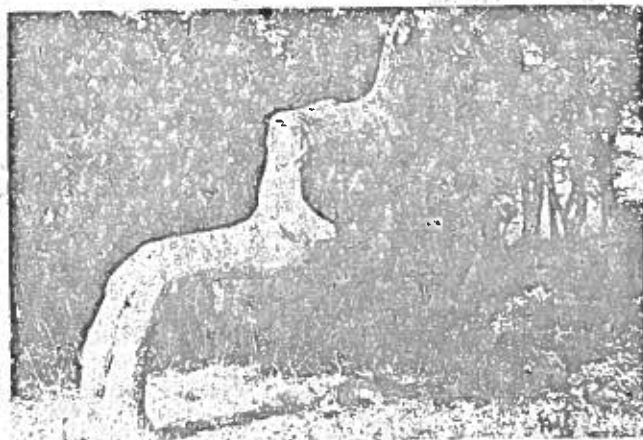
En af de »vrange« ege

Ekskursionen begav sig nu ud til Nederkrattet, hvor man vandrede gennem den gamle løvskov for rigtigt at få et pust