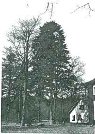
Den omtalte nordmannsgran.