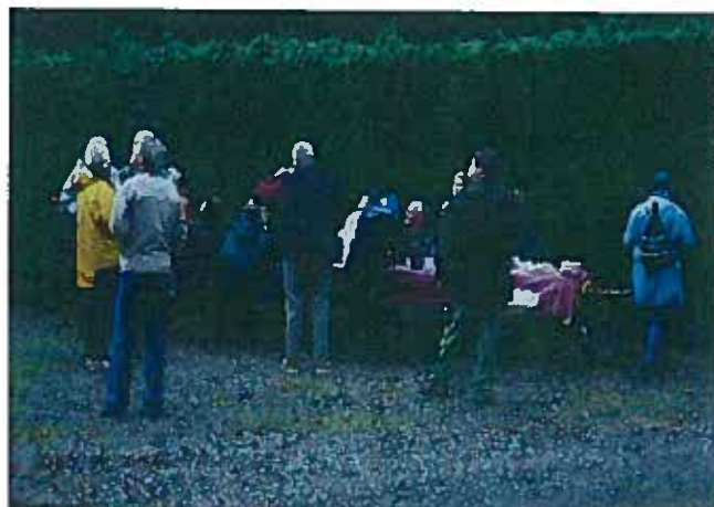
Det er altid godt at starte en tur med rundstykker og kaffe.