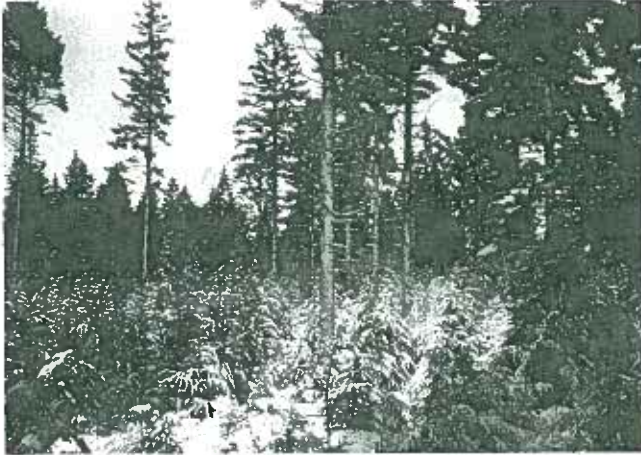
Tsugaerne i vinteren 1965/66.

For at friske op på turen plukker Per Ramsgaard nogle grandiskviste. »I skal lige have en god duftoplevelse«. Kort efter når vi til »Jyndovn«, en langdyse på 74 meter. Den er fra 3.000 - 5.000 år før vor tidsregning.