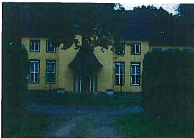
Skovhistorisk Selskabs ekskursion den 25/09 2004 starter ved Klelund villa.