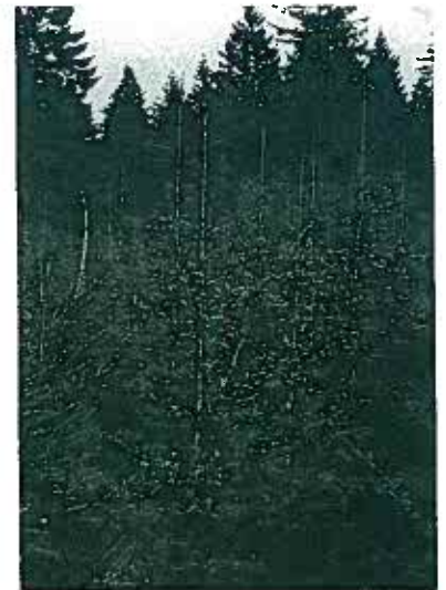
Så fint trivedes omorica i Klelund i 1966, så det er vel forståeligt, vi var glade for denne træart.

Den medbragte mad indtages i en god atmosfære. Da vi når til kaffen, fortæller den gode skovfoged lidt om Hovborg Plantage, der ligger tæt herved.